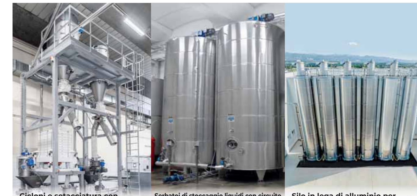
Cycloni e setacciatura con plansichter e vaglio centrifugo