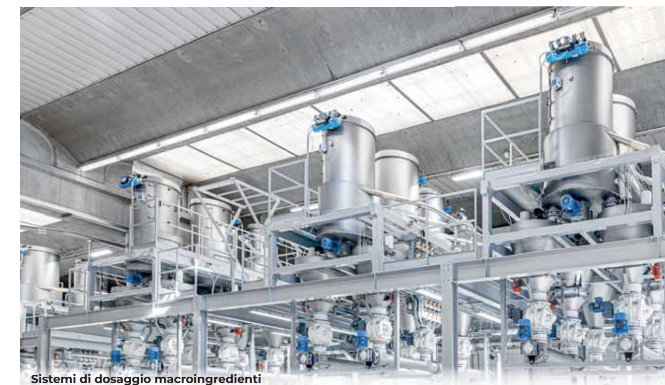
Sistemi di dosaggio macroingredienti