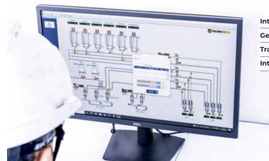
SCADA - Controllo ottimale del processo di lavorazione