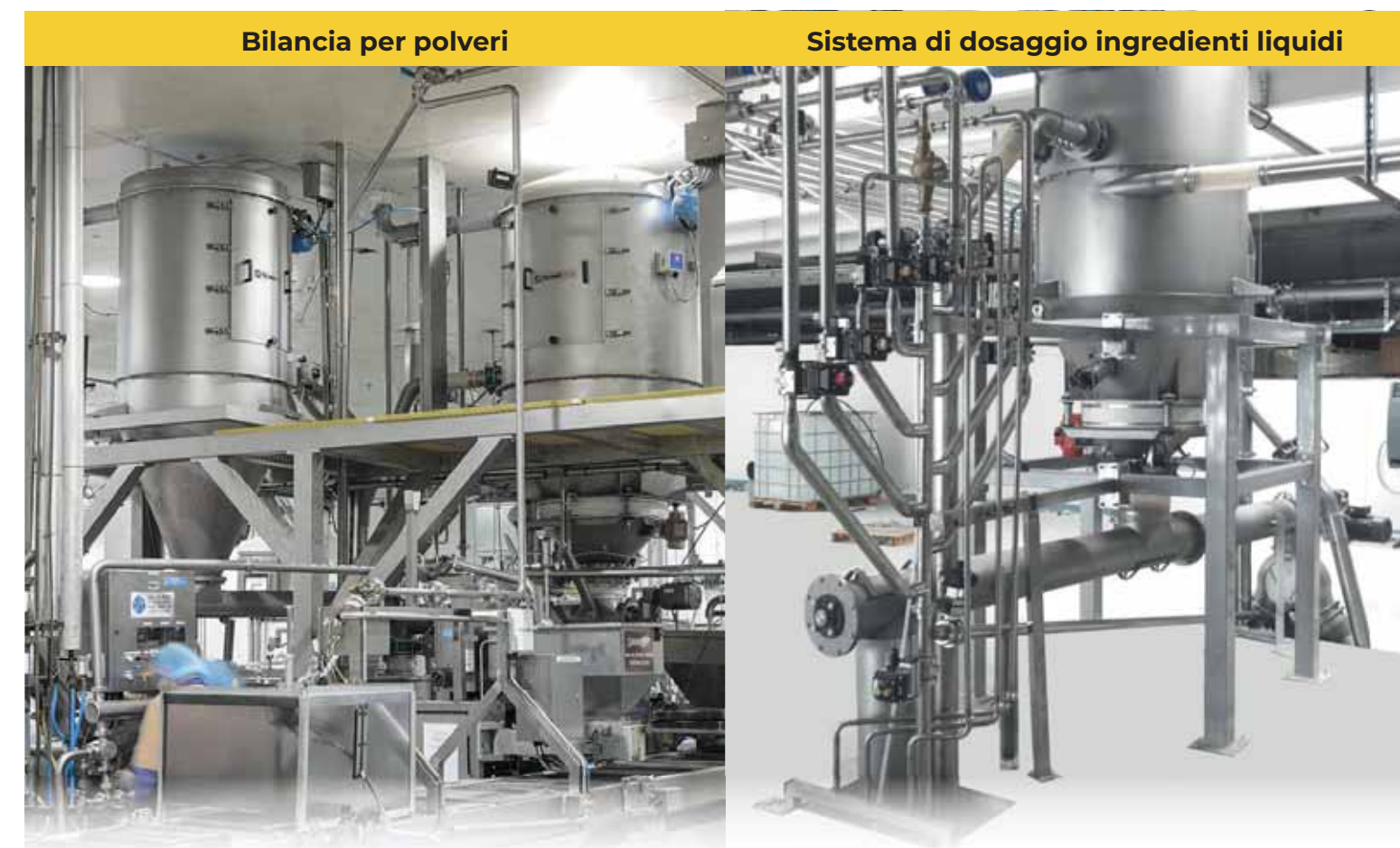
Bilancia per polveri

Gli impianti Technosilos rispondono naturalmente ai più severi requisiti internazionali in termini di igienicità e sicurezza.