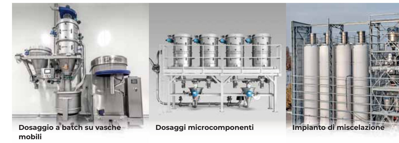
Dosaggio a batch su vasche mobili