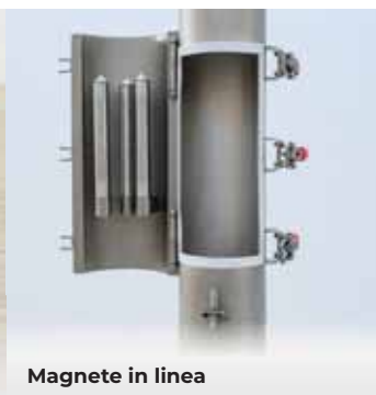
Magnete in linea