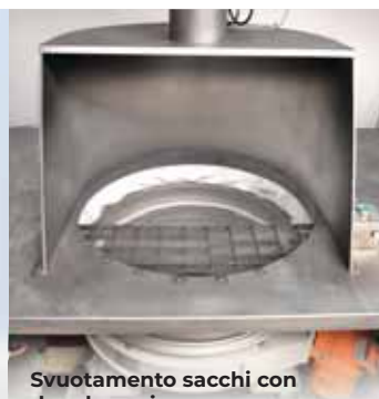
Svuotamento sacchi con depolverazione